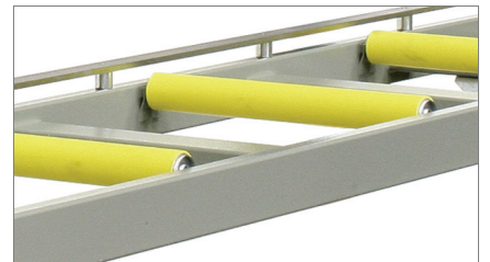
Base de rodillos de descarga Base de rodillos